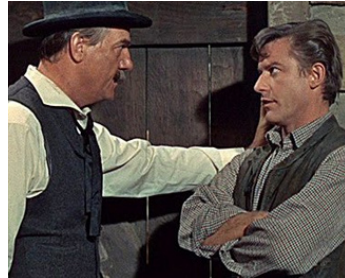
1967 L'HONORABLE GRIFFIN (Bullwhip Griffin) de James Neilson avec Roddy McDowall