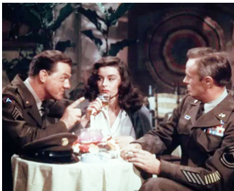
1953 SERGENT LA TERREUR (Take the high-ground) de R. Brooks avec Elaine Stewart, R. Widmark