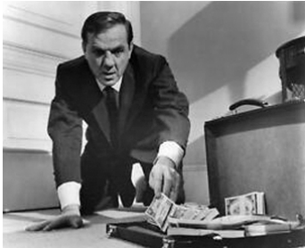
1966 HÔTEL SAINT-GREGORY (Hotel) de Richard Quine