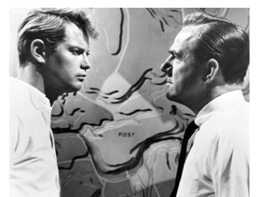
1961 L'ANGE DE LA VIOLENCE (All fall down) de John Frankenheimer avec Troy Donahue