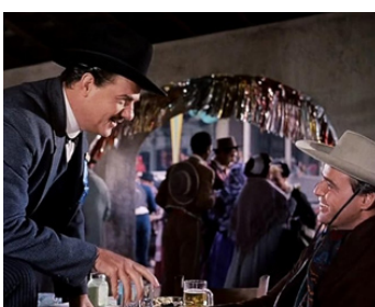
1960 LA VENGEANCE AUX DEUX VISAGES (One-Eyed Jacks) de et avec Marlon Brando