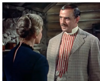
1958 LA COLLINE DES POTENCES (The Hanging Tree) de Delmer Daves avec Maria Schell