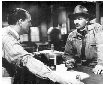
1949 LA CIBLE HUMAINE (The Gunfighter) d'Henry King avec Gregory Peck