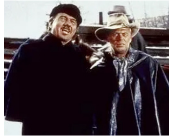
1963 LES CHEYENNES (Cheyenne Autumn) de John Ford avec Richard Widmark