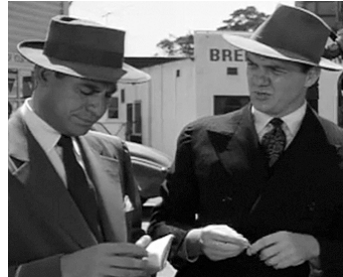
1951 LE SURSIS (The Sellout) de Gerald Mayer avec John Hodiak