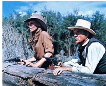
1968 EL GRINGO (Blue) de Silvio Narizzano avec Joanna Pettet