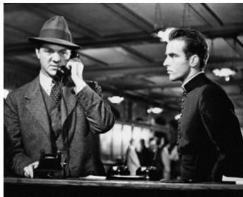
1952 LA LOI DU SILENCE (I confess) d'Alfred Hitchcock avec Montgomery Clift