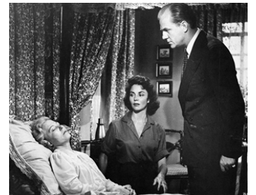
1952 LA FURIE DU DÉSIR (Ruby Gentry) de King Vidor avec J. Hutchinson, Jennifer Jones