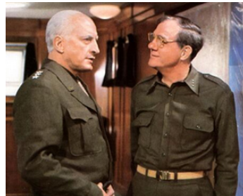
1969 PATTON (Patton) de Franklin J. Schaffner avec George C. Scott