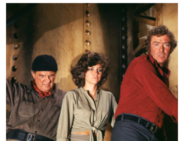
1979 LE DERNIER SECRET DU POSÉIDON d'Irwin Allen avec Sally Field, Michael Caine