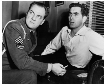
1952 COURRIER DIPLOMATIQUE (Diplomatic Courier) d'Henry Hathaway avec Tyrone Power