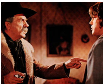
1970 DEUX HOMMES DANS L'OUEST (Wild Rovers) de Blake Edwards avec Joe Don Baker