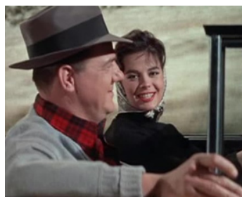
1957 BOMBARDIER B52 (Bombers B-52) de Gordon Douglas avec Natalie Wood