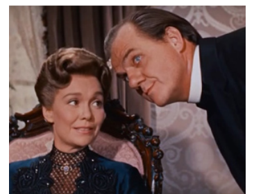
1959 POLLYANNA (Pollyanna) de David Swift avec Jane Wyman