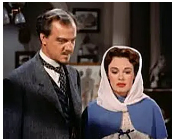
1953 LE FANTÔME DE LA RUE MORGUE (Phantom of the Rue Morgue) de R. Del Ruth avec P. Medina