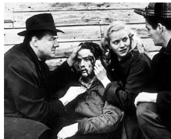
1954 SUR LES QUAIS (On the Waterfront) d'Elia Kazan avec Marlon Brando, Eva-Marie Saint