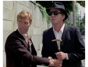
1969 LE CHAT À NEUF QUEUE (Il Gatto a nine code) de Dario Argento avec James Franciscus