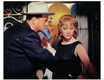
1962 LES FILLES DE L'AIR (Come fly with me) d'Henry Levin avec Lois Nettleton