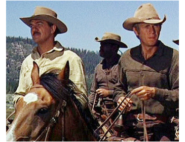
1965 NEVADA SMITH (Nevada Smith) d'Henry Hathaway avec Steve McQueen