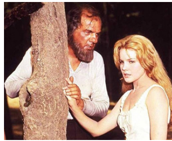
1962 LA CONQUÊTE DE L'OUEST (How the West was won) d'H. Hathaway avec Carroll Baker