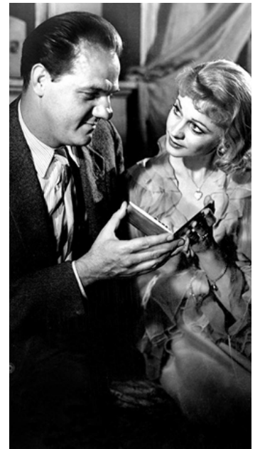
1951 UN TRAMWAY NOMMÉ DÉSIR (A Streetcar named Desire) d'Elia Kazan avec Vivien Leigh