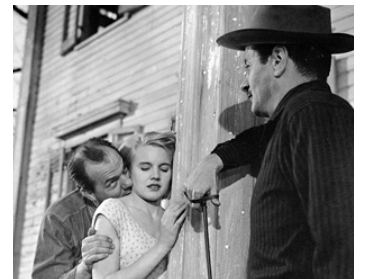
1956 LA POUPÉE DE CHAIR (Baby Doll) d'Elia Kazan avec Carroll Baker, Eli Wallach