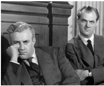
1946 BOOMERANG (Boomerang !) d'Elia Kazan avec Lee J. Cobb