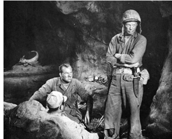
1950 OKINAWA (Halls of Montezuma) de Lewis Milestone avec Richard Widmark