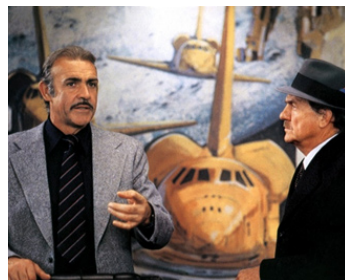
1978 MÉTÉORE (Meteor) de Ronald Neame avec Sean Connery