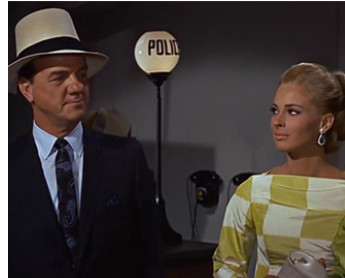
1966 BIEN JOUÉ MATT HELM (Murderer's Row) d'Henry Levin avec Camilla Sparv