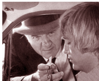
1971 MEURTRES AU SOLEIL (Un Verano para matar) d'A. Isasi-Isasmendi avec Ch. Mitchum