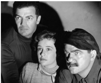
1952 OPÉRATION SECRÈTE (Operation Secret) de L. Seiler avec Cornel Wilde, Phyllis Kirk