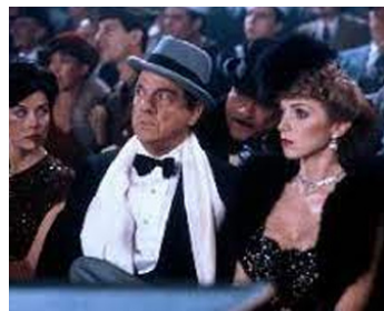
1983 L'ARNAQUE 2 (The Sting II) de Jeremy Paul Kagan avec Teri Garr