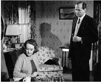
1963 LA MORT FRAPPE TROIS FOIS (Dead Ringer) de Paul Henreid avec Bette Davis