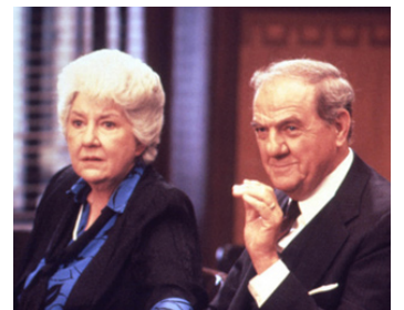
1987 CINGLÉE (Nuts) de Martin Ritt avec B. Streisand, Maureen Stapleton