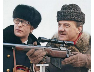
1967 UN CERVEAU D'UN MILLIARD DE DOLLARS (Billion Dollar Brain) de K. Russell avec M. Caine