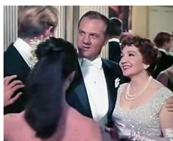
1961 LA SOIF DE LA JEUNESSE (Parrish) de Delmer Daves avec Claudette Colbert