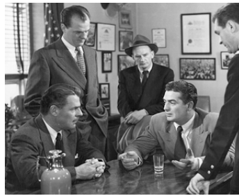
1947 LE CARREFOUR DE LA MORT (Kiss of Death) d'H. Hathaway avec B. Donlevy, Victor Mature