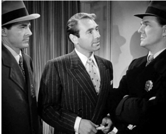
1950 MARK DIXON, DÉTECTIVE (Where the Sidewalks ends) d'O. Preminger avec D. Andrews, Gary Merrill