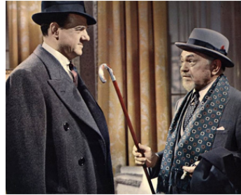
1965 LE KID DE CINCINNATI (The Cincinnati Kid) de N. Jewison avec Edward G. Robinson