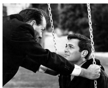
1961 LE ROI DES IMPOSTEURS (The great Impostor) de Robert Mulligan avec Tony Curtis