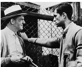
1957 PRISONNIER DE LA PEUR (Fear strikes out) de Robert Mulligan avec Anthony Perkins