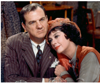
1961 GYPSY, VÉNUS DE BROADWAY (Gypsy) de M. LeRoy avec Rosalind Russell