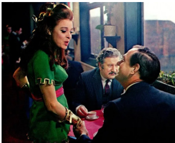
1968 CHAUD LES MILLIONS ! (Hot Millions) d'Eric Till avec Maggie Smith, Peter Ustinov